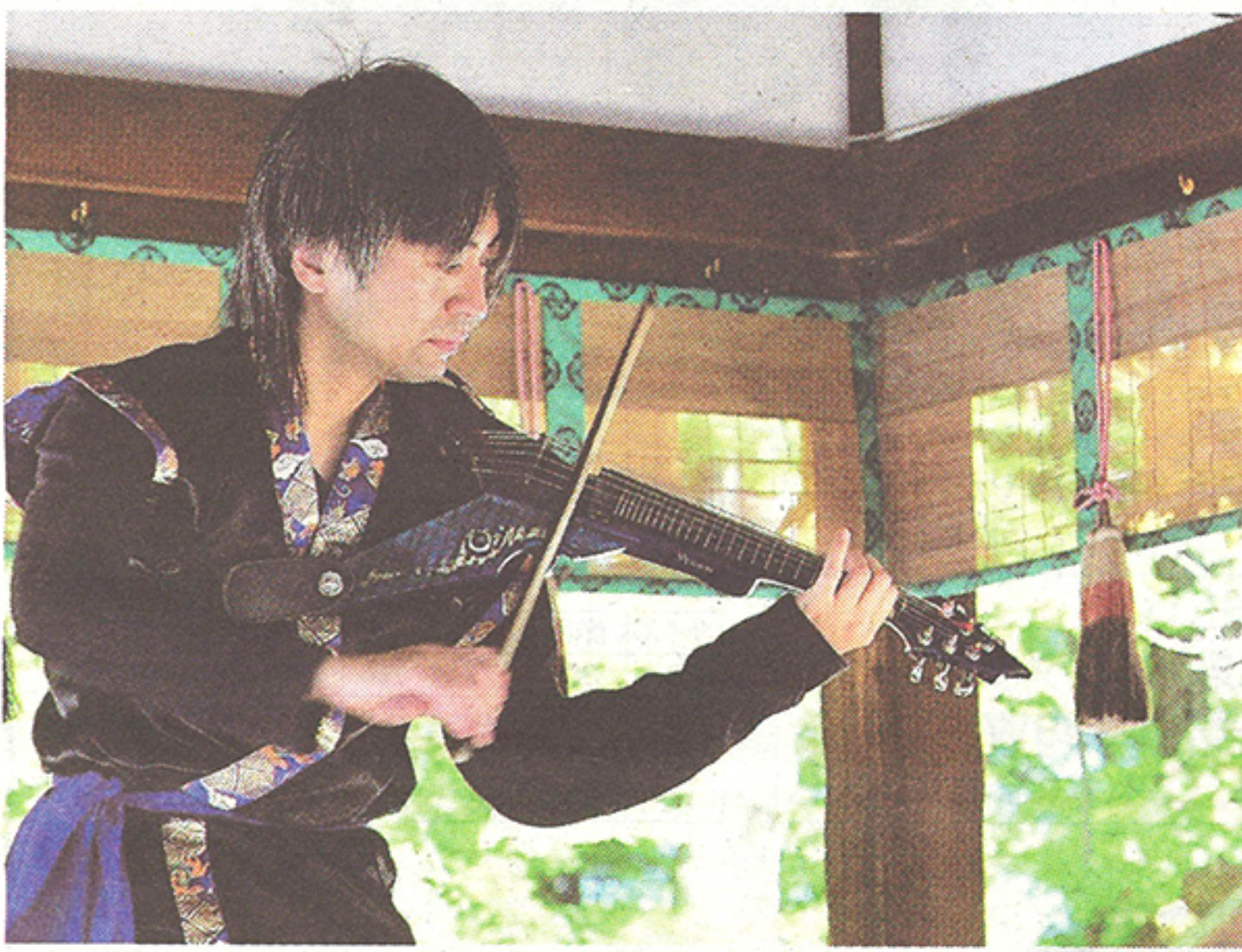
河合神社 (京都・下鴨神社) コンサートより