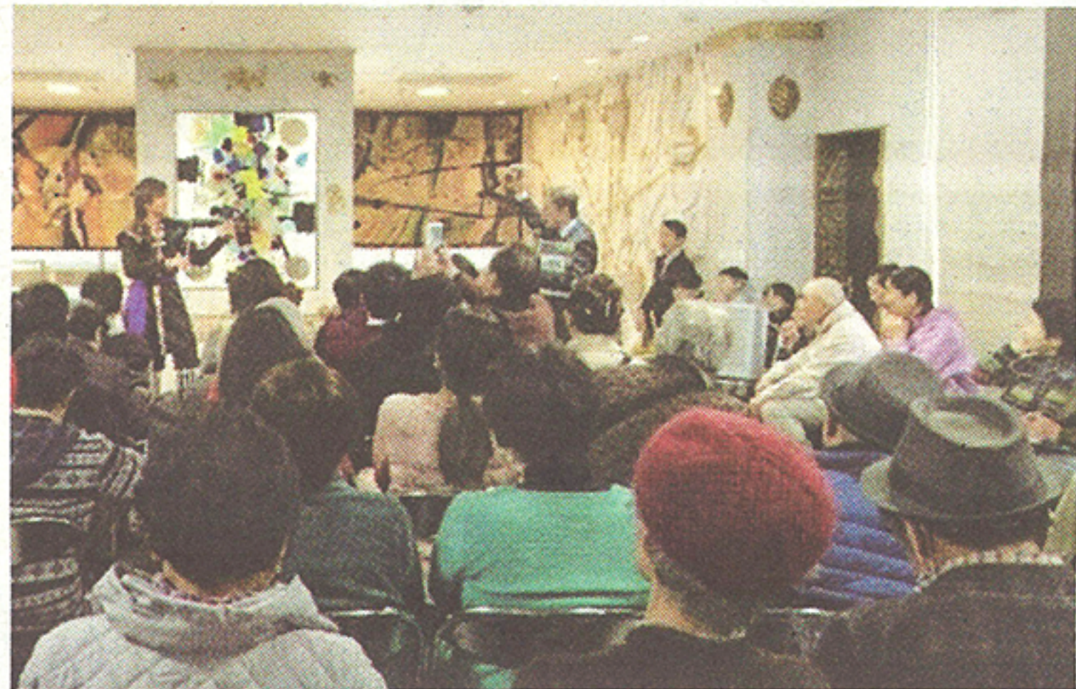
京都府立堂本印象美術館コンサート。珍しい楽器に皆、興味津々

沖繩音楽を英語で紹介するなど、海外も視野に入れた。カナダの学校でCDを紹介したとき、エディンバラ(スコットランド)で好評を得て、今年(二〇二〇年)一月には念願叶って、アメリカでMarkさんに会い、「君の音楽は誰のものとも違う」との称賛をもらった。 今後さらに琉球ヴァイオリンやヴァイパーの素晴らしさが広がっていくことを願っている。